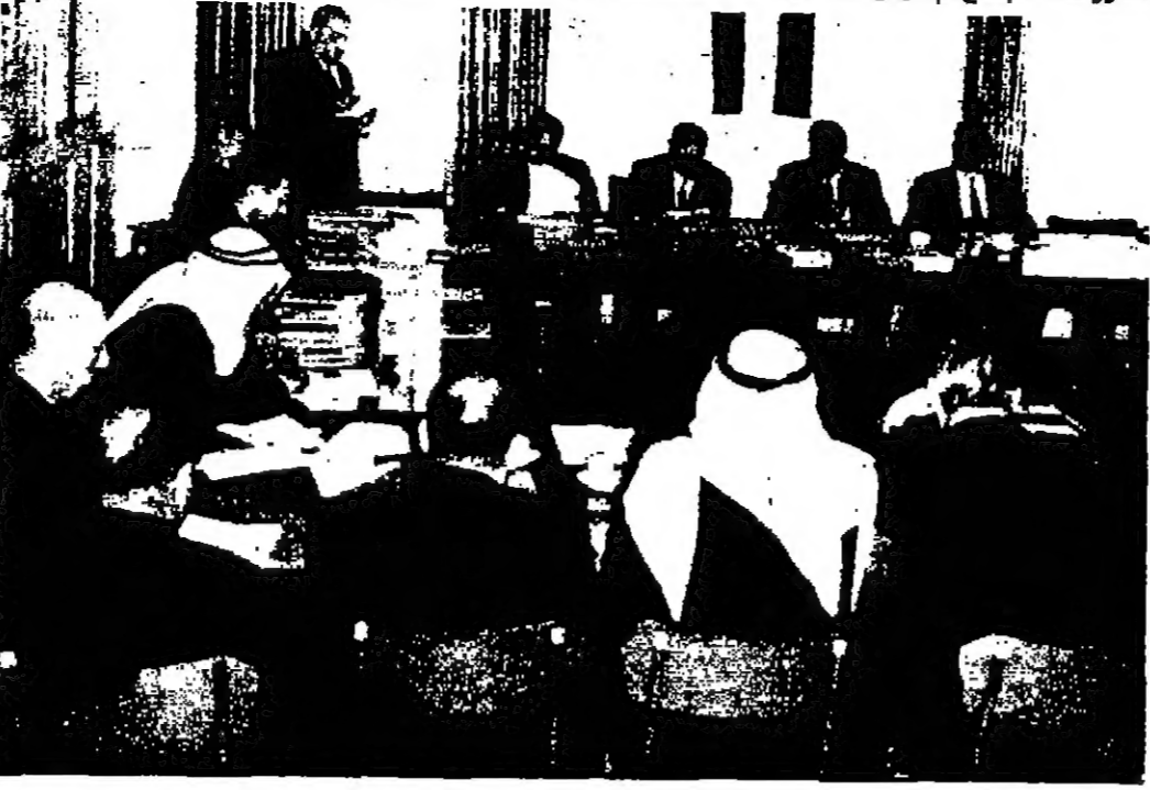
جانب من الاجتماع السنوي للجنة العامة لهلال الأحمر

عمان - قدمت اللجنة العامة لجمعية الهلال الأحمر الاردني اجتماعها السنوي صباح امس في مركز الجمعية بالشرقية برئاسة الدكتور احمد ابو قوره رئيس الجمعية . وقد افتتحت اللجنة العامة لجمعية الهلال الأحمر الاردني اجتماعها السنوي صباح امس في مركز الجمعية بالشرقية برئاسة الدكتور احمد ابو قوره رئيس الجمعية .